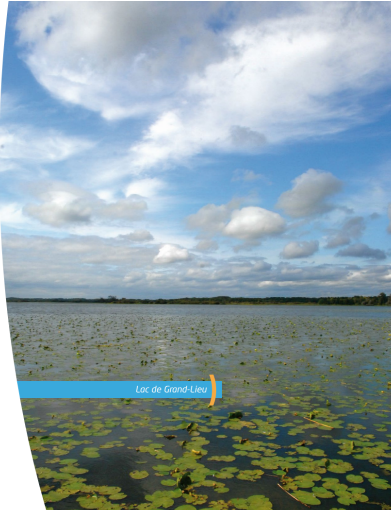
Lac de Grand-Lieu